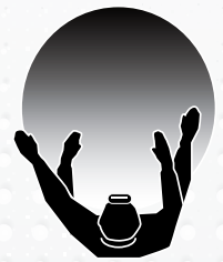
NIGHT VIEW HEADLAMP