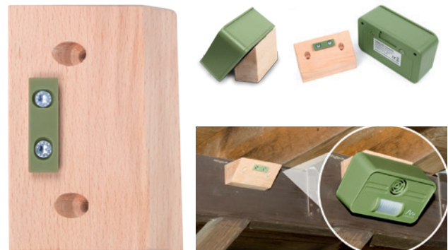
Wandhalterung: Art.-Nr. 60056

Die Wandhalterung ermöglicht die Befestigung im oberen Wandbereich und stellt durch den Winkel sicher, dass der Bewegungsmelder auch auf Bewegungen auf dem Boden reagiert.