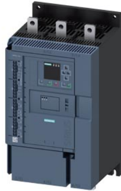
SIRIUS Sanftstarter 200-690 V 315 A, AC 110-250 V Federzugklemmen