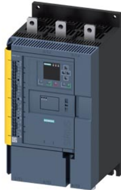
SIRIUS Sanftstarter 200-480 V 570 A, AC/DC 24 V Federzugklemmen Failsafe