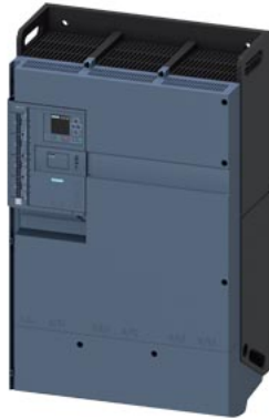
SIRIUS Sanftstarter 200-690 V 1280 A, AC/DC 24 V Federzugklemmen