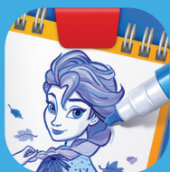
Super Studio Disney Frozen 2