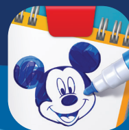
Super Studio Disney Mickey Mouse & Friends