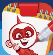
Super Studio Disney • Pixar Incredibles 2