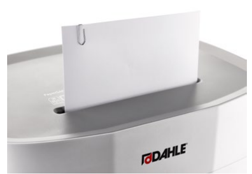
Dahle Aktenvernichter PaperSAFE® 240