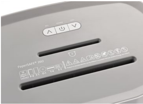
Dahle Aktenvernichter PaperSAFE® 260