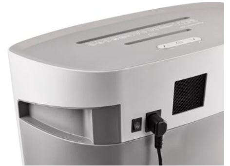
Dahle Aktenvernichter PaperSAFE® 260