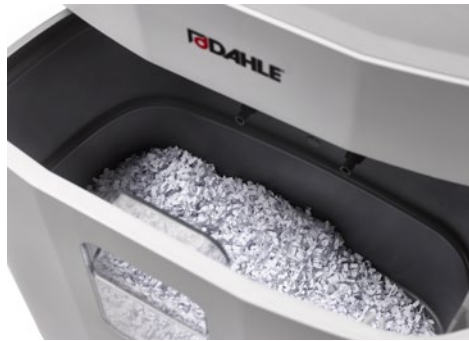
Dahle Aktenvernichter PaperSAFE® 260