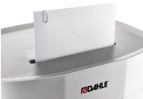
Dahle Aktenvernichter PaperSAFE® 260