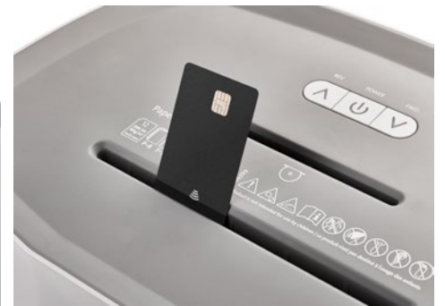
Dahle Aktenvernichter PaperSAFE® 260