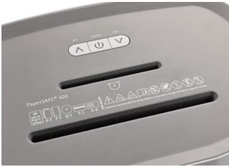
Dahle Aktenvernichter PaperSAFE® 420