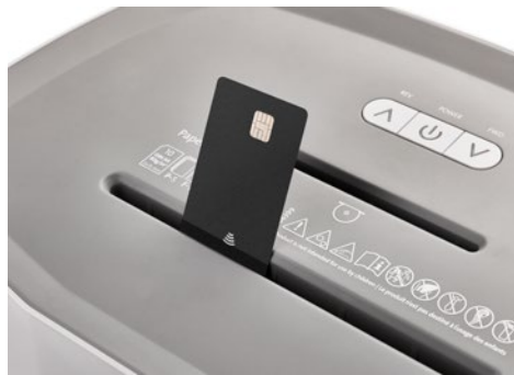
Dahle Aktenvernichter PaperSAFE® 420