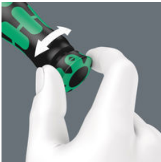
Mit hör- und fühlbarem Einrasten bei Erreichen der Skalenwerte.