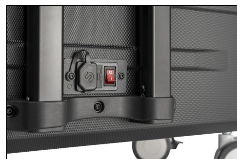
- Hauptschalter , Überspannungsschutz