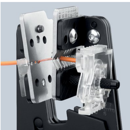
Formschlüssiges Abisolieren durch präzise Messerprofile

Kapton® ist ein eingetragenes Warenzeichen der E. I. du Pont de Nemours and Company/Radox® ist ein eingetragenes Warenzeichen der Huber & Suhner AG