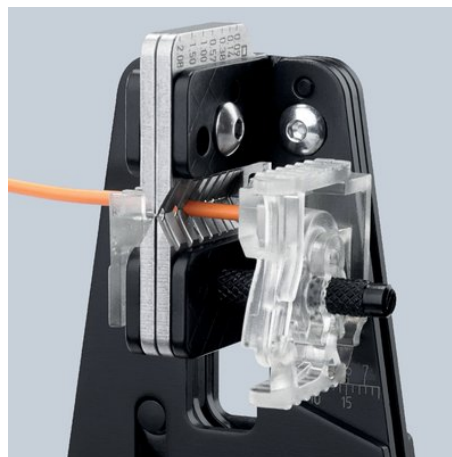
Sauberes Einschneiden der Isolation auf dem gesamten Umfang