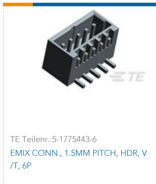
TE Teilnr.:5-1775443-6 EMIX CONN., 1.5MM PITCH, HDR, V /T, 6P