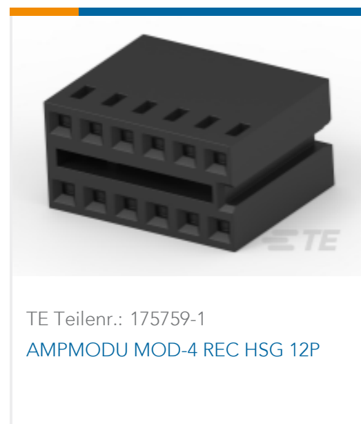
TE Teilnr.: 175759-1 AMPMODU MOD-4 REC HSG 12P