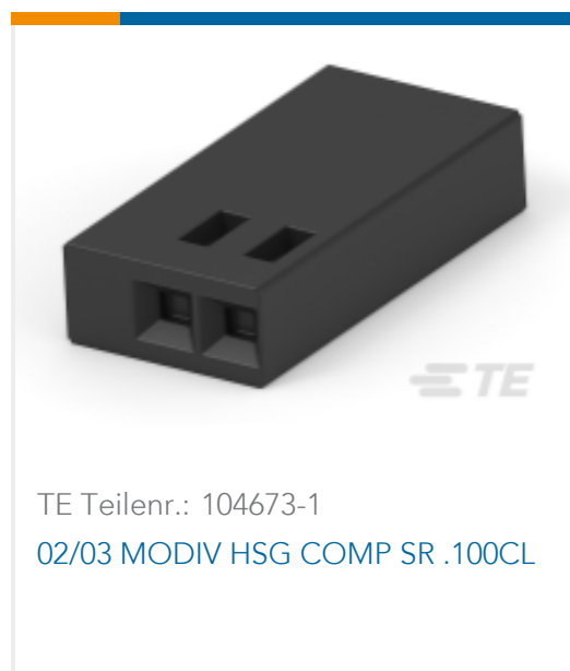
TE Teilnr.: 104673-1 02/03 MODIV HSG COMP SR .100CL