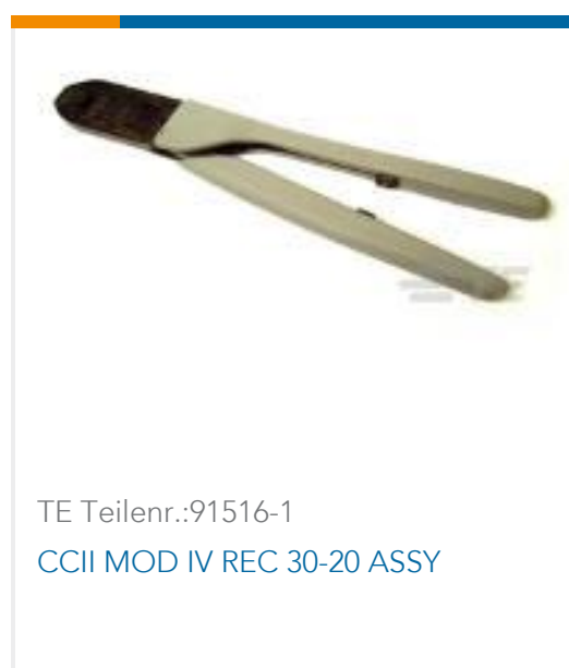
TE Teilnr.:91516-1 CCII MOD IV REC 30-20 ASSY