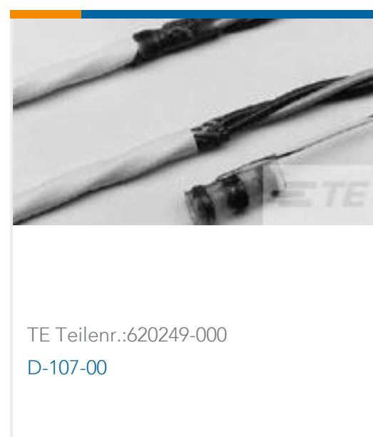
TE Teilnr.:620249-000 D-107-00