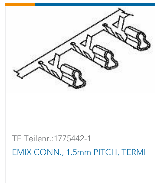
TE Teilnr.:1775442-1 EMIX CONN., 1.5mm PITCH, TERMI