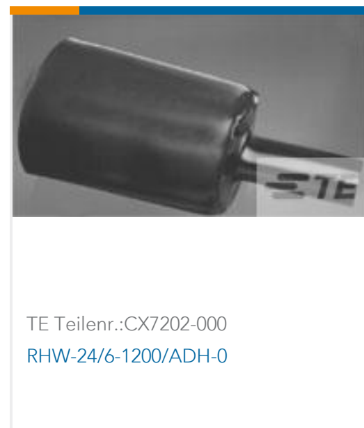
TE Teilnr.:CX7202-000 RHW-24/6-1200/ADH-0