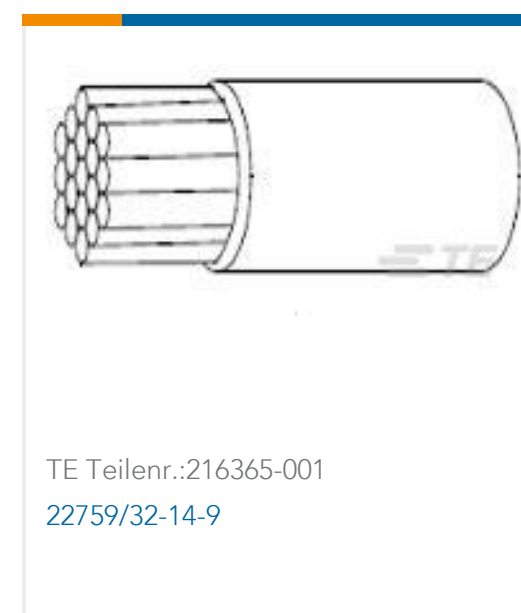
TE Teilnr.:216365-001 22759/32-14-9