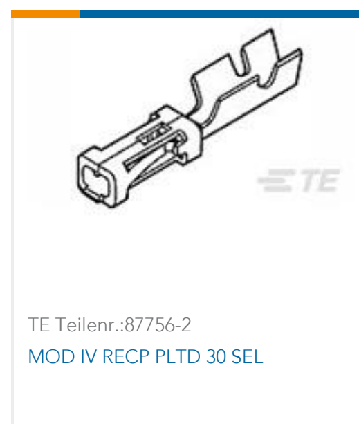
TE Teilnr.:87756-2 MOD IV RECP PLTD 30 SEL