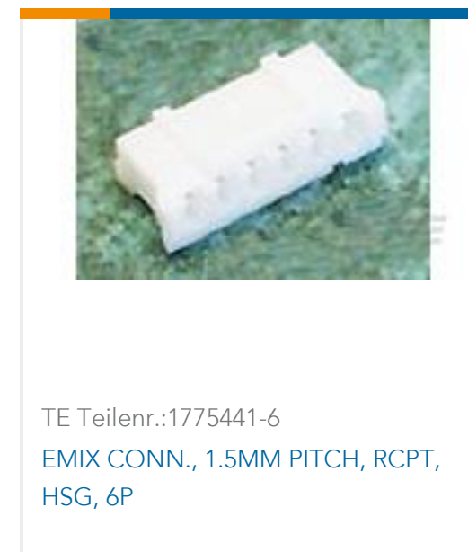
TE Teilnr.:1775441-6 EMIX CONN., 1.5MM PITCH, RCPT, HSG, 6P