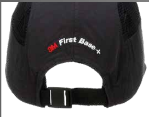
Elastisches Band zur Anpassung an die Kopfgröße

Genießen Sie den Komfort einer Baseballmütze für den benötigten Anstoßschutz mit einer 3M™ First Base™ + Anstoßkappe. Wenn Sie auf engem Raum arbeiten und dabei auf scharfe Kanten, niedrige Decken oder herabhängende Gegenstände achten müssen, bieten diese Anstoßkappen zusätzlichen Schutz vor Verletzungen. Die coolen Kappen sind in unterschiedlichen Farben und Schirmlängen erhältlich und eignen sich ideal für Beschäftigte in der Automobilbranche, der Luft- und Raumfahrt, Lebensmittelverarbeitung oder in Transport und Logistik. Sie sind nicht nur bequem und schick, sondern ermöglichen auch eine gute Luftzirkulation und können optional mit einem Logo bestickt werden.*