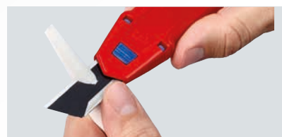
Durch die innovative Klingenstabilisierung lässt sich sicherer Druck direkt auf die Klinge ausüben.