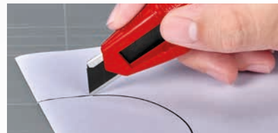
Ergonomische Form mit vielen Greifzonen ermöglicht sicheres und präzises Arbeiten.