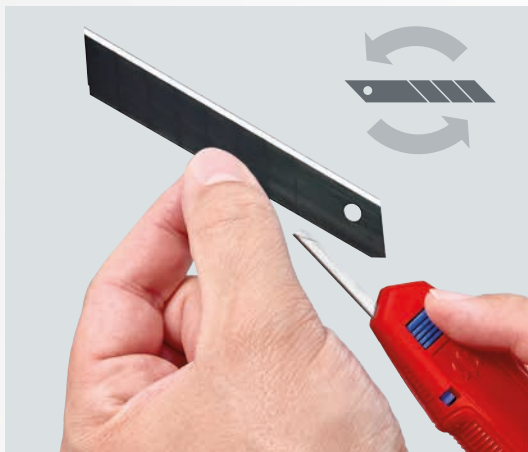
Flink wieder scharf: Die Klingen lassen sich ohne Werkzeug und mit nur einem Knopfdruck wechseln.