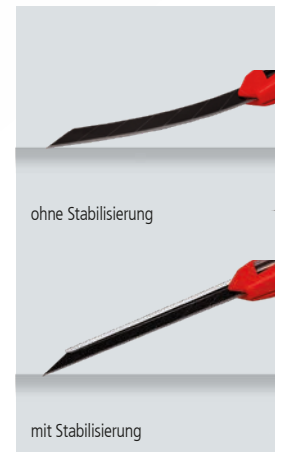
Flexibel: Je nach Bedarf ist die Klinge starr oder biegsam nutzbar.