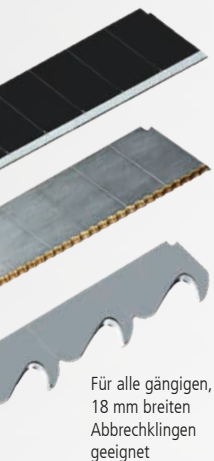
Für alle gängigen, 18 mm breiten Abbrechklingen geeignet