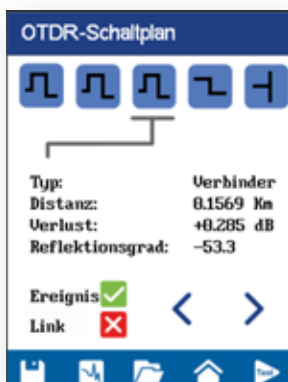
Anzeige von Ereignis und Ereignistyp mit eindeutiger Pass/Fail-Bewertung