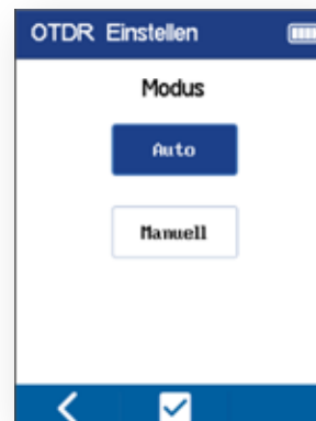
Auswahl des Testmodus