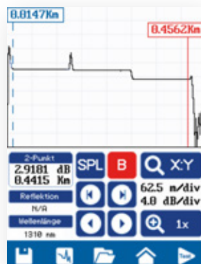
Anzeige der OTDR-Kurve zur weiteren Auswertung

Alle FiberMASTER OTDRs unterstützen das Glasfaser-Prüfmikroskop