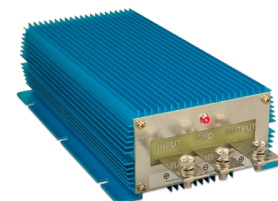
Orion IP67 24/12-100 Orion IP67 12/24-50