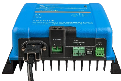
Phoenix Smart 12/50(1+1)