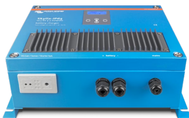
Skylla-IP65 12/70 (1+1)

Weitere Informationen über Batterien und das Laden von Batterien finden Sie in unserem Buch "Energy Unlimited" (Uneingeschränkte Energie) (über Victron Energy kostenfrei erhältlich oder zum Herunterladen unter www.victronenergy.com ).