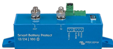
Smart BatteryProtect BP-100