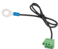
Stecker mit vormontiertem DC-Minus-Kabel (mitgeliefert)