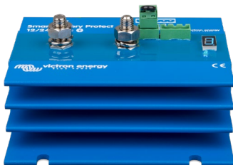
Smart BatteryProtect BP-220