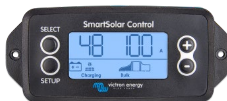
SmartSolar einsteckbares Display

Entfernen Sie einfach die Gummidichtung, die den Stecker an der Vorderseite des Reglers schützt und stecken Sie das Display ein.