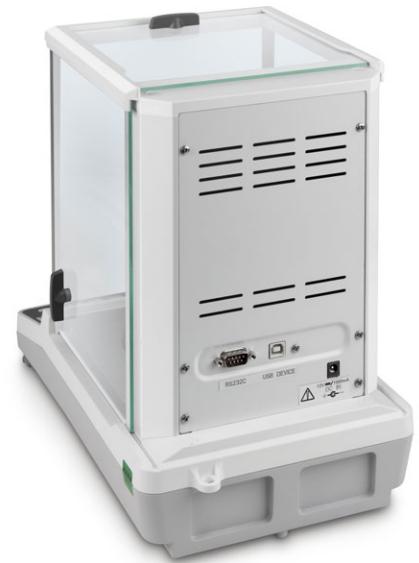
KERN ACS/ACJ mit serienmäßiger Datenschnittstelle RS-232 und USB

Der Bestseller unter den Analysenwaagen, mit hochwertigem Single-Cell Wägesystem, auch mit Eichzulassung [M]