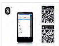
Save'n carry App