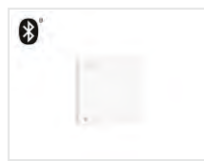
Multisensor LS 20.00 pro4