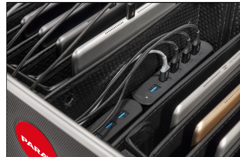
- Stauraum für bis zu 20 Tablets , TwinCharge Technologie