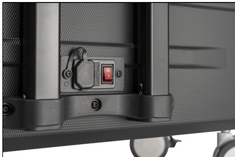
- Hauptschalter , Überspannungsschutz