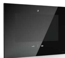
auch in der Farbe schwarz erhältlich