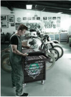
Exklusiver Werkstattwagen im Tool Rebel Design