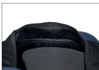
Schweißband aus Funktionsgewebe