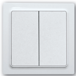
Funktaster mit Doppelwippe