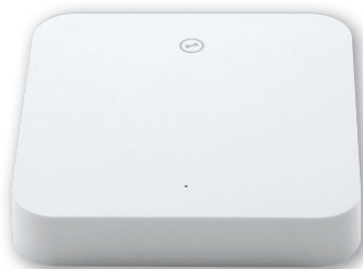
wibutler pro 2 Professional Smart Home-Controller