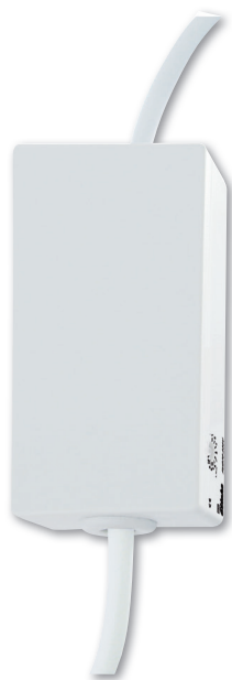
Funktions-Drehschalter auf der Seite