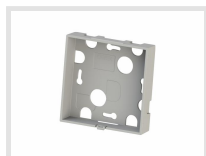
Rückwand für Aufputz- Verkabelung 200.004