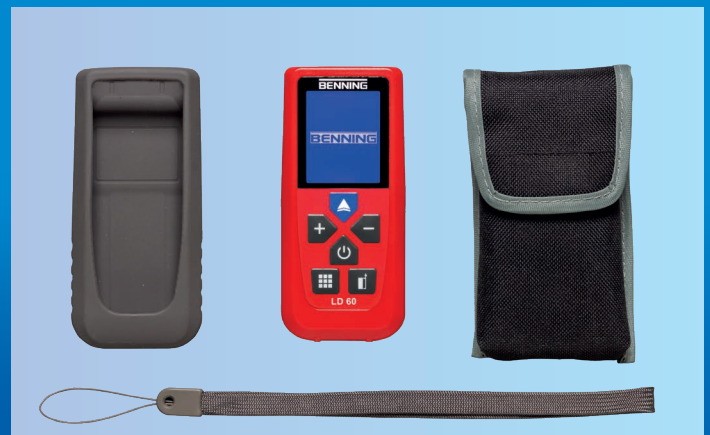
Lieferumfang LD 60