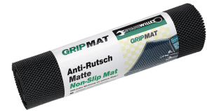
89010003 Antirutschmatte GRIPMAT