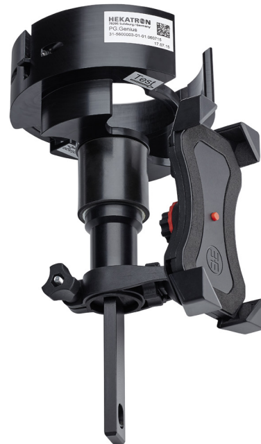
Abb. 1: Prüfgerät Genius mit Smartphone-Halterung (Abbildung ähnlich)