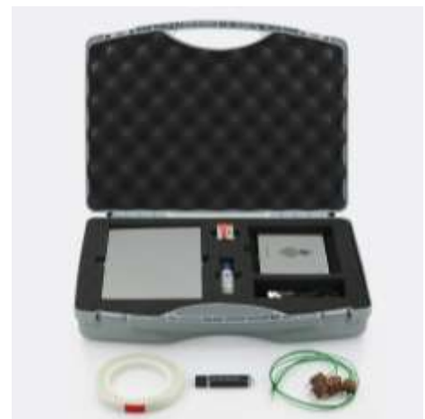
Lieferumfang Thermologger 5000