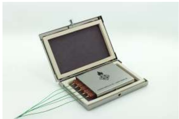
Thermologger 5000 mit Thermalbox

Die exakte Einstellung und Überwachung von Temperaturprofilen ist eine grundlegende Voraussetzung für einen optimalen Lötprozess. Dies gilt sowohl für Wellen- als auch für Reflowlötverfahren. Die Wichtigkeit einer exakten Einstellung hat sich in Hinsicht auf die Umstellung auf bleifreie Lötprozesse noch verstärkt, da Prozessfenster kleiner werden: Die Prozesse werden nahe an den Belastungsgrenzen der verwendeten Materialien wie Leiterplatten, elektronische und mechanische Bauteile, aber auch der Flussmittel und Lotpasten gefahren. Zur Überwachung sind selbst bei modernen Lötmaschinen externe Geräte notwendig, mit denen die entsprechenden Lötprofile aufgezeichnet werden können. Da jede Baugruppe ein anderes thermisches Verhalten aufweist, ist es in der Regel notwendig, für jede Baugruppe eine andere Ofenabstimmung zu wählen.