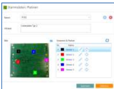
Leiterplatte mit Fühlerpositionen

Im Bereich Stammdaten werden Informationen zu Lötanlagen, verwendeten Lote, Hüllkurven und den verwendeten Testleiterplatten hinterlegt.