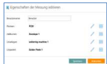
Eingabe der Testbedingungen

Durch Einblendung der verschiedenen Zonen inkl. der eingestellten Temperaturen des Ofens wird dem Maschinenbediener angezeigt, in welcher Zone die entsprechenden Änderungen vorzunehmen sind. Die Softwareoberfläche wurde so gestaltet, dass alle wichtigen Informationen auf einen Blick zur Verfügung stehen. Es werden die Temperaturprofile inkl. des Sollbereichs dargestellt. Zudem erhält der Anwender eine tabellarische Übersicht über die wichtigsten Kenngrößen.