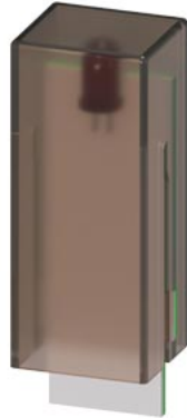
LED-Modul, rot für Steckrelais Reihe PT und RT, 110-230 V AC ohne Freilaufdiode