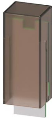
RC-Glied, AC 24-48 V