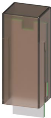
RC-Glied, AC 110-230 V