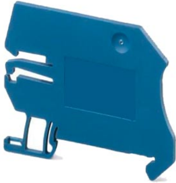
Auflagebock für Trennklemme, Klemmengröße 10 bis 35mm 2 , Breite 2mm, blau