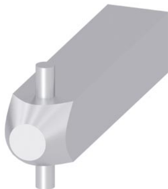
Wellenstumpf für Türkupplungsdrehantrieb 500mm Zubehör für Leistungsschalter 3VA27 (Kipphebel)