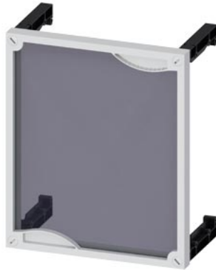
Leerfeldabdeckung mit Sichtfenster H=300mm, B=250mm