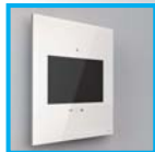
zum Schluss Monitoreinheit über magnetische Quick-Snap Arretierung fixieren... fertig!