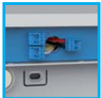
Rückgehäuse anbringen und Verdrahtung vornehmen