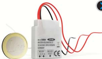
1-Euro Münze zum Größenvergleich

Vorhandener drahtgebundener Klingeltaster wird mit diesem Converter zu einem drahtlosen Funk-Klingeltaster