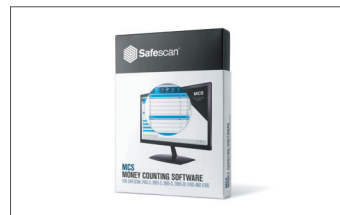
Safescan MCS Software Art.no: 124-0500