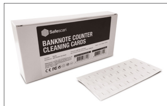
Safescan Reinigungskarten Art.no: 152-0663