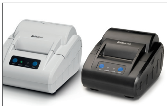
Safescan TP-230 Thermodrucker Art.no: 134-0475 grau Art.no: 134-0535 schwarz