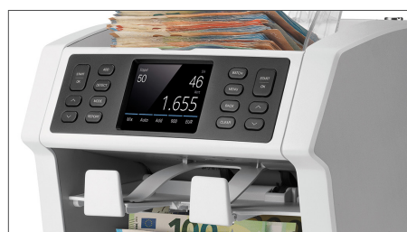
Schnelles Zählen und Sortieren von Banknoten dank mehrerer automatisierter Funktionen