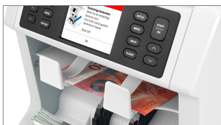
Legt mutmaßlich gefälschte Banknoten in das dafür vorgesehene Rückweisungsfach