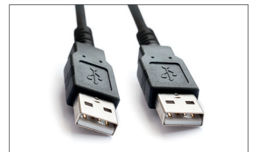
Safescan USB-Kabel Art.no: 124-0458