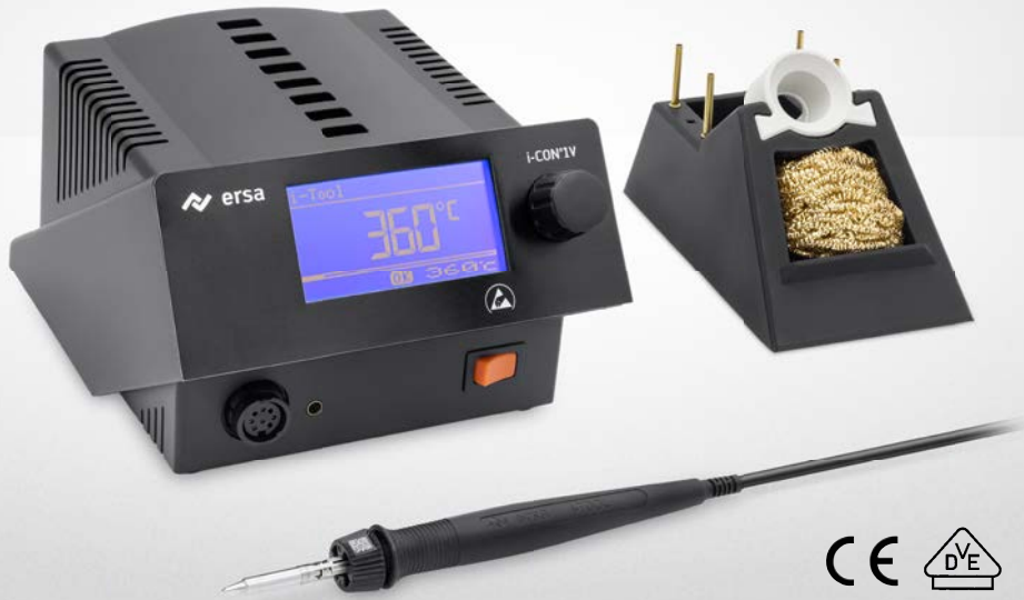
i-CON 1V MK2 mit i-TOOL MK2