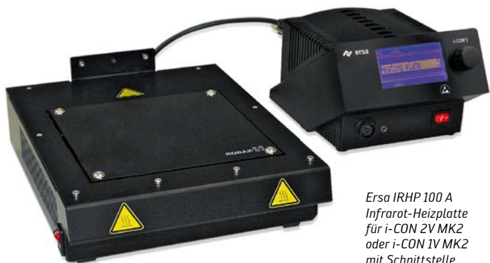
Ersa IRHP 100 A Infrarot-Heizplatte für i-CON 2V MK2 oder i-CON 1V MK2 mit Schnittstelle.