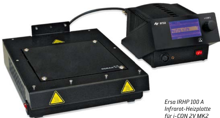
Ersa IRHP 100 A Infrarot-Heizplatte für i-CON 2V MK2 oder i-CON 1V MK2 mit Schnittstelle.