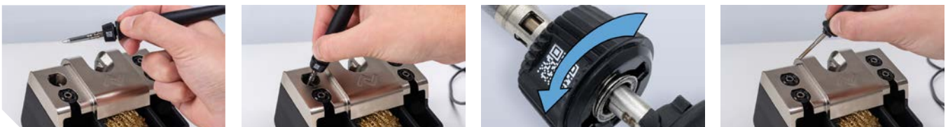
Blitzschneller Spitzenwechsel: von Hand oder mit Hilfe des Ablageständers 0A58, kompatibel mit i-TOOL TRACE und allen LötKolben der i-TOOL MK2 (optional).