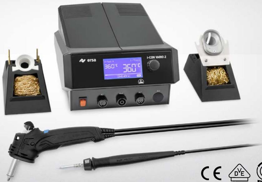
i-CON VARIO 2 MK2 mit i-TOOL MK2 & X TOOL VARIO