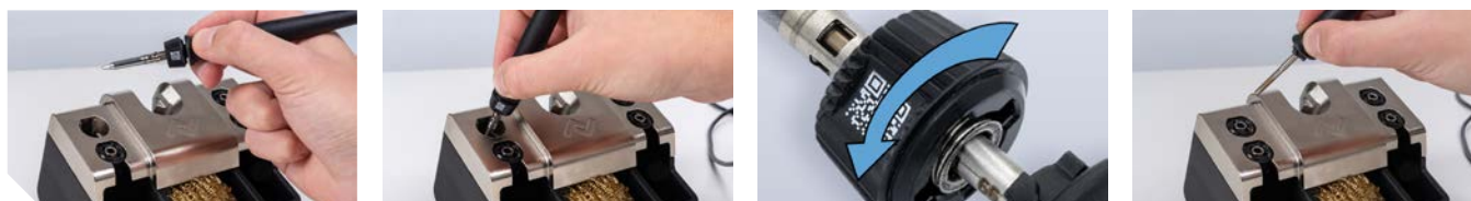
Blitzschneller Spitzenwechsel: von Hand oder mit Hilfe des Ablageständers 0A58. Dieser ist kompatibel mit i-TOOL TRACE und allen Lötkolben der i-TOOL MK2 Serie (optional).