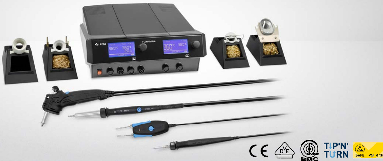
i-CON VARIO 4 MK2 mit X-TOOL VARIO, i-TOOL AIR S, CHIP TOOL VARIO & i-TOOL MK2