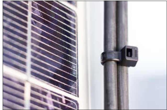
Umweltfreundlicher Kabelbinder der T-Serie mit sehr guter chemischer und UV-Beständigkeit.