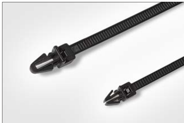
Bei engen Einbauverhältnissen eignen sich besonders die Kabelbinder T30RSF und T50RSF.